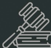
Execução Fiscal para Fins Penais