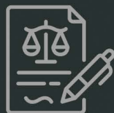
Autos de Infração