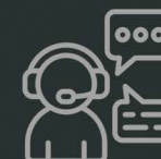
Atendimento de Intimações