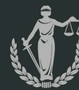
Ministério Público Federal e Estadual