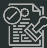
Regularização de Débitos em Procuradorias Estaduais e Federais