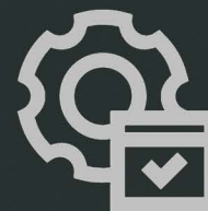
Administrativo e Gestão Pública