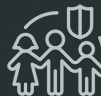
Família e Sucessões